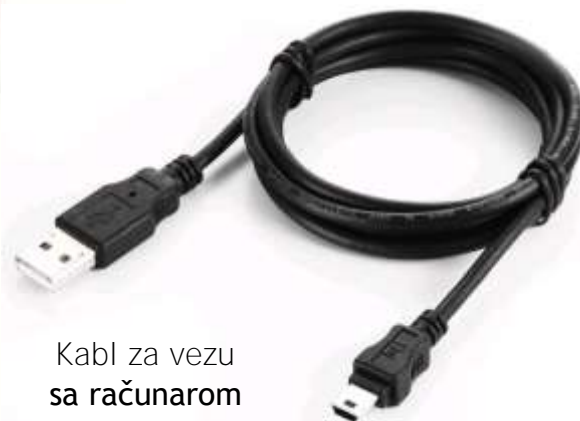
Kabl za vezu sa računarom